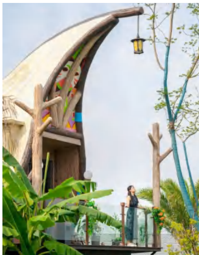
▲个个世界自然营地

茂密的绿林,北欧风的尖顶小木屋—小红书上经常刷屏的“武汉小挪威”“北欧小森林”,就是位于蔡甸香草花田附近的个个世界自然营地。