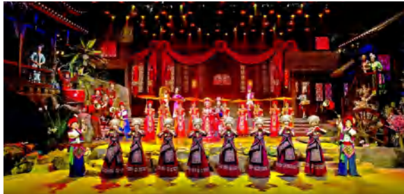
▲土家民俗歌舞秀《花咚咚的姐》

在当天的活动中,中共中央政治局委员、中宣部部长李书磊,中共中央政治局委员、广东省委书记黄坤明等领导参观了湖北馆,对湖北文化的创新发展