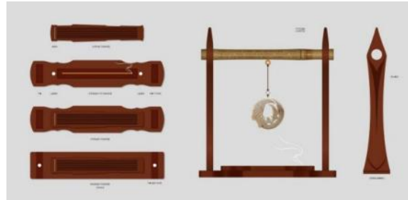
▲楚香·凤来仪香薰桌摆

5月23日,第二十届中国(深圳)文博会上,光明日报社和经济日报社联合向社会发布“2024·全国文化企业30强”(简称“30强”)名单,并首次发布“2024·全国成长性文化企业30强”(简称“成长性30强”)名单。其中,湖北3家企业上榜。