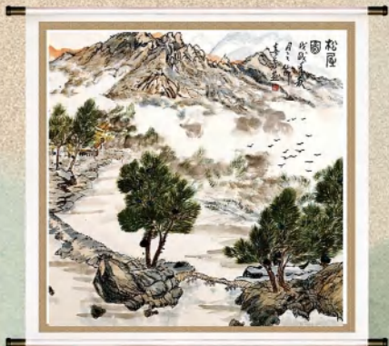
书画作品 作者:胡春方