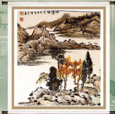
书画作品 作者:张萍华