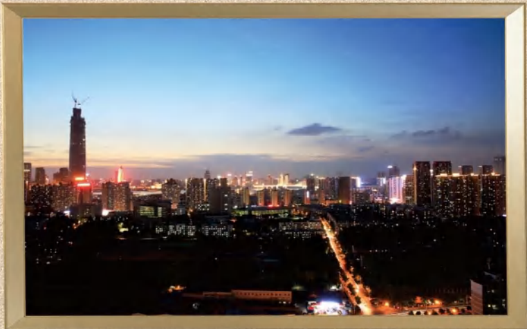
摄影作品《魅力武昌》 作者:吴怡安