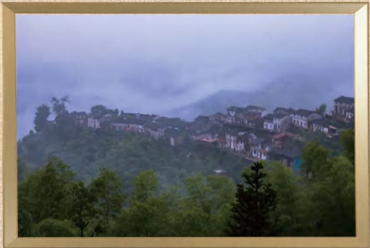
摄影作品《云雾中的山村》 作者:赵临璋