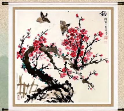
书画作品 作者:方泽民