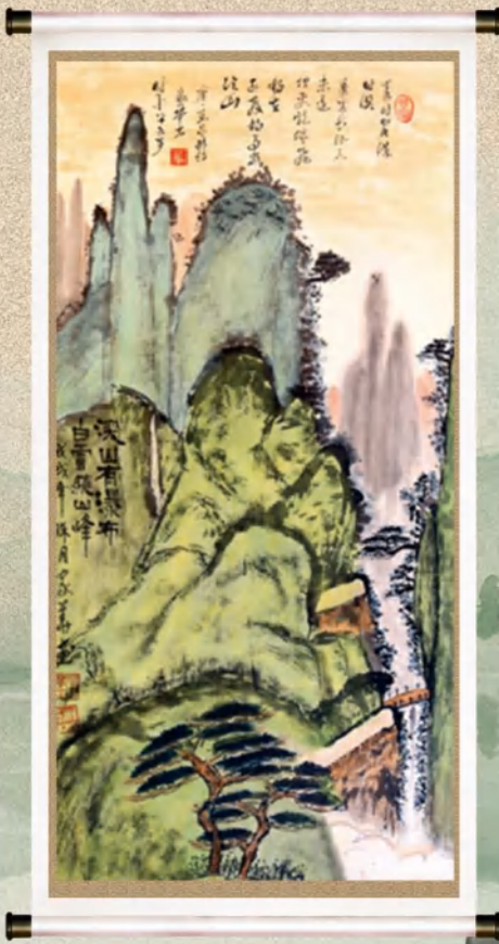
书画作品 作者:杨家华