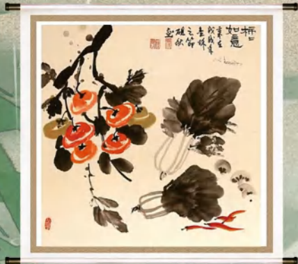
书画作品 作者:张砚秋