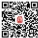
湖北省古玩和 艺术品商会