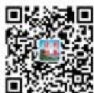
湖北省委统战部 官方微信公众号

武汉市各大宾馆、酒店、咖啡吧、茶馆；银行贵宾区、湖北各机场、高铁站、南航贵宾厅、 湖北省图书馆和 100 余所高校图书馆、泰康人寿所有营业网点 湖北省委统战部、省工商联、 省楚商联合会、华中商学院、武汉（1+8）都市圈大型公共场所、《楚商》杂志等所有活 动发行现场等