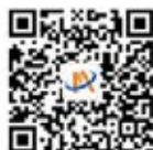
湖北省工商联 官方微信公众号