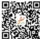
湖北省武汉城市 圈商贸服务商会