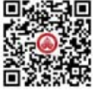
北京市湖北企业商会