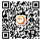
湖北省青年 企业家协会