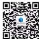
湖北省企业管理 咨询服务协会