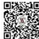
湖北省浙江企业 联合会（总商会）