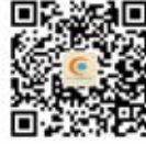
湖北省企业 国际合作协会