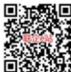
联企 e 站二维码