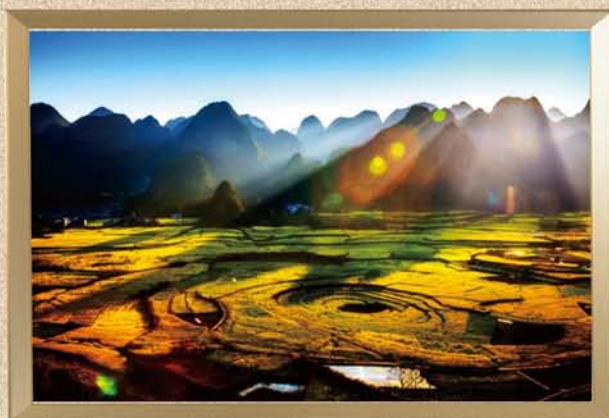
摄影作品 《七彩云南》