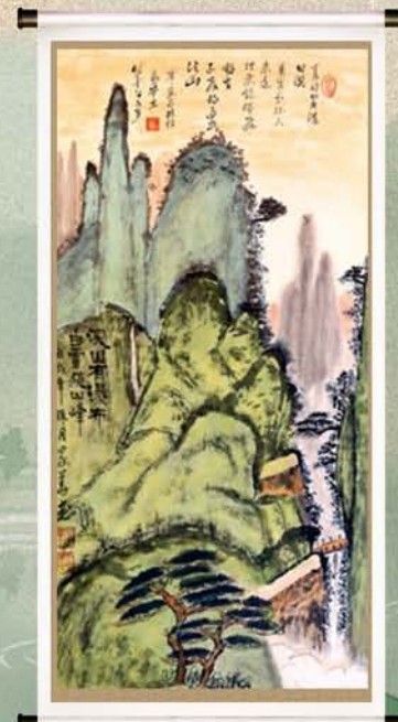
书画作品 作者:杨家华