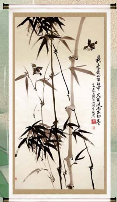
书画作品 作者:方泽民