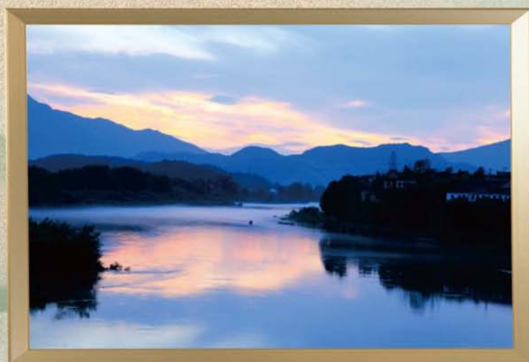
摄影作品《晚霞映照桃花潭》 作者:曹汉东