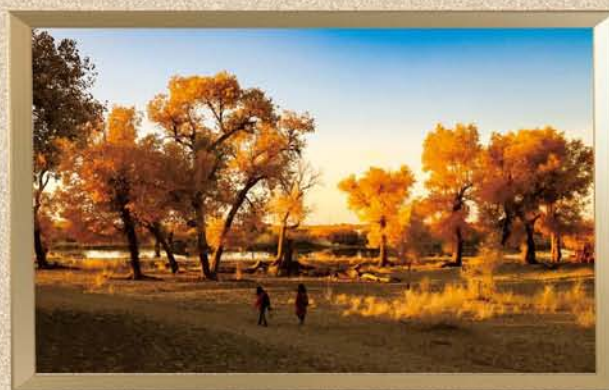
摄影作品 《余晖照胡杨》