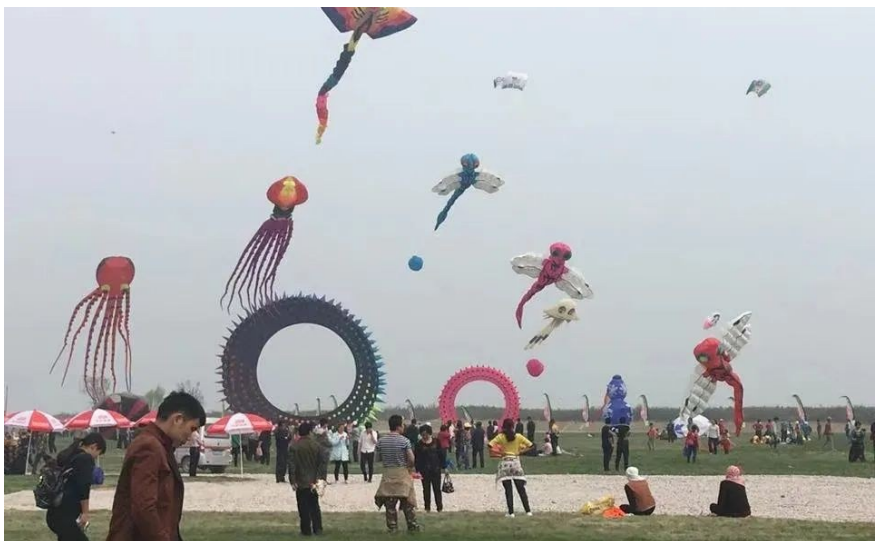
武汉放风筝最佳打卡地