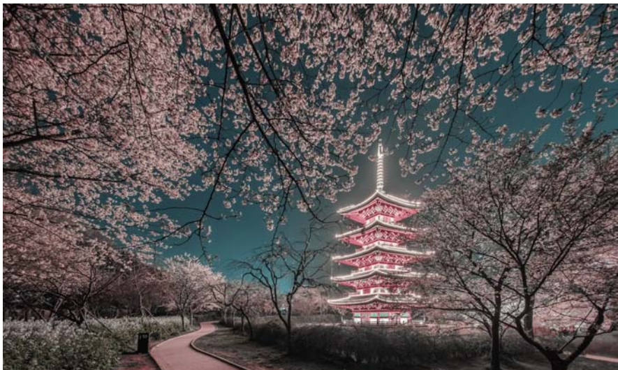
2024 春季·武汉花海预报 ▶ 11 版