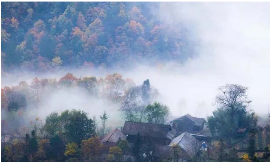
找春天，来“有风的村子”吧 ▶ 11 版