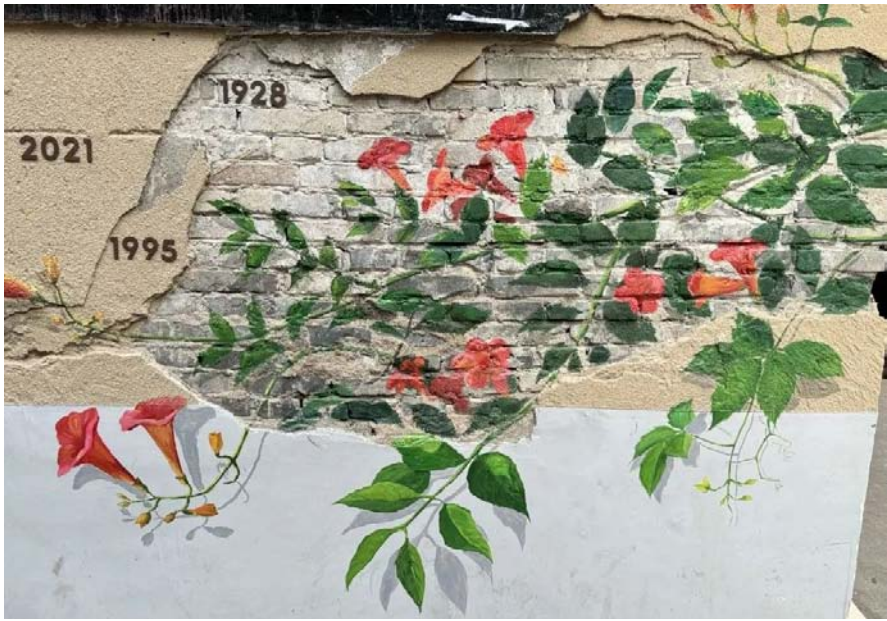
江岸老里份 玩出“新花样” ▶ 11 版