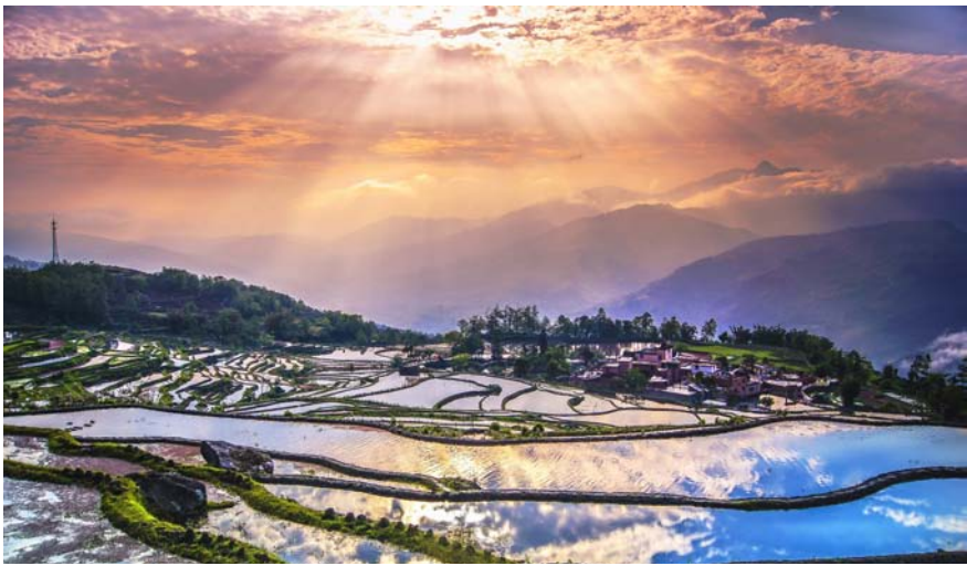
天空之境——云南元阳