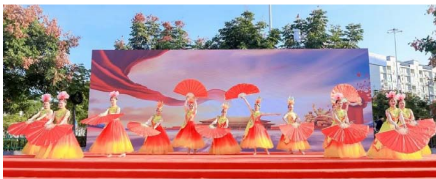
▲开场舞蹈《辉煌中国梦》

终贯彻习近平总书记的嘱托,致力于推动大型易地搬迁安置区融入新型城镇化并实现高质量发展。我们围绕人民群众的需求,发扬脱贫攻坚时期的斗争精神,激发搬迁群众的内生动力,努力将易迁安置区打造成为新型城镇化的标杆、乡村振兴的样板以及共同缔造的示范区。本次“三个最美”评选活动,这不仅肯定了我们易迁后扶工作上的努力,也是对我们进一步做好全区易迁工作的巨大鼓舞。我们将认真学习兄弟县市区的优秀经验和做法,用实际行动致敬‘最