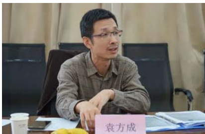
▲华中师范大学教授、博导袁方成