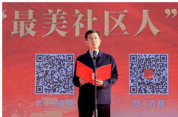
▲十堰市郧阳区区委书记胡先平致欢迎辞