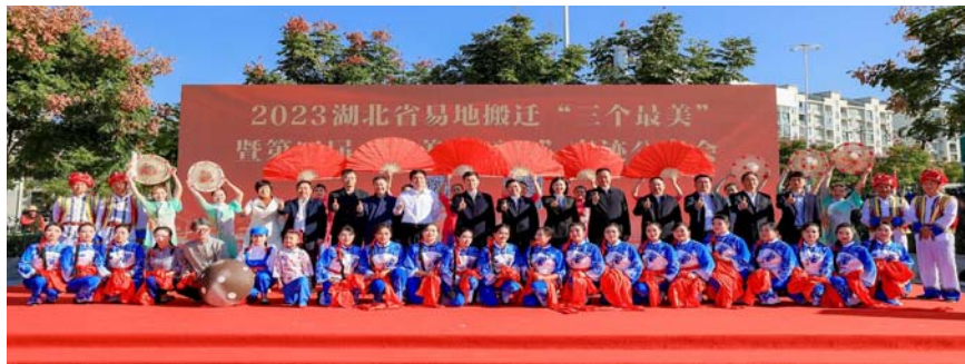
▲领导、嘉宾合影留念