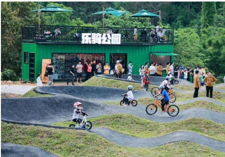
旅游新玩法:体育线路游 ▶ 11 版