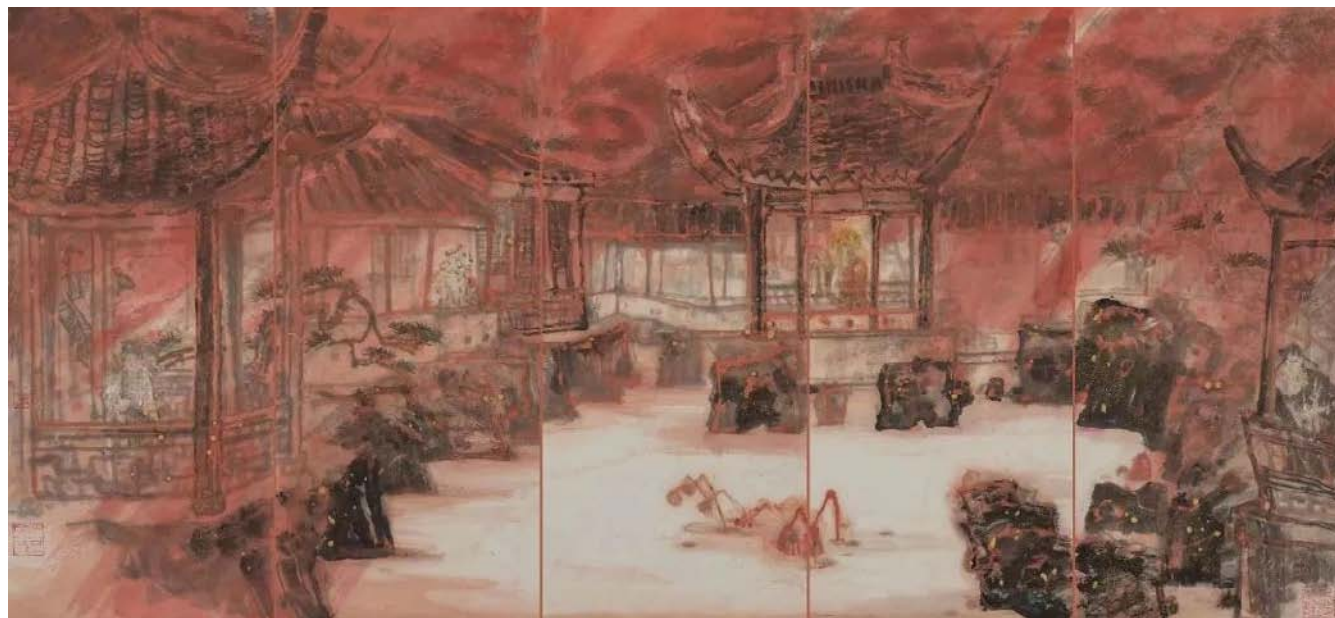
▲周石峰中国画作品展