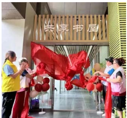
▲社区书记与志愿者为共享书屋揭牌