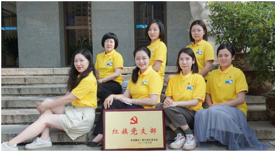
广电报业公司党支部荣获“红旗党支部”称号