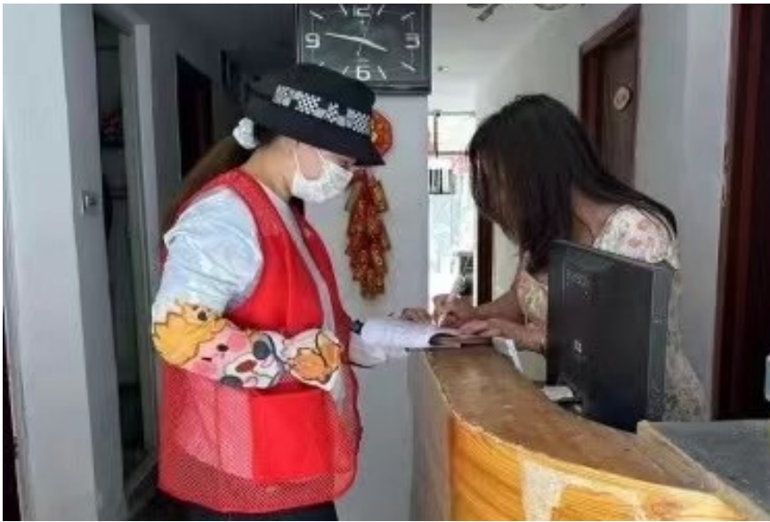
▲“红管家”开展入户服务