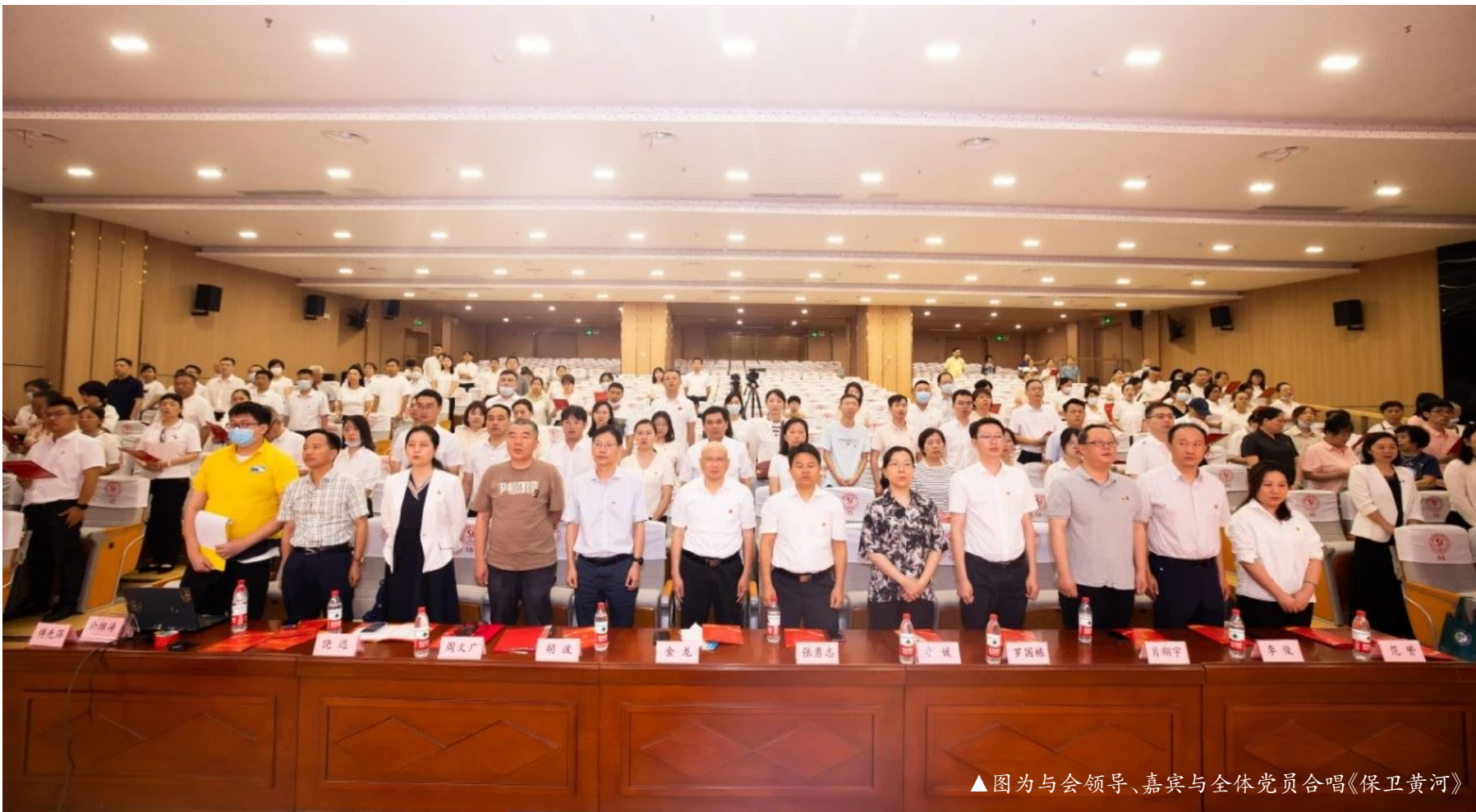
▲ 图为与会领导、嘉宾与全体党员合唱《保卫黄河》