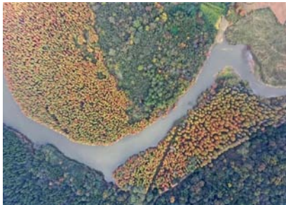
▲湖北太子山国家森林公园

位于鄂中江汉平原与大洪山余脉交汇处的湖北太子山国家森林公园,京山南部。截至 2008 年,公园面积 7930 公顷,森林覆盖率 80.4%,年降水量 800 毫米以上。湖北太子山国家森林公园在 2001 年被评定为省级森林公园,2002 年 12 月被评定为国家级森林公园,2011 年被授予“国家生态文明教育基地”称号。截至 2009 年,湖北省太子山国家森林公园分布着地球上仅能在此湖成片生长的国家级一保护植物对节白腊在内的常绿或落叶针叶林、阔叶林、林下植被等 138 科、204 属近 400 种。