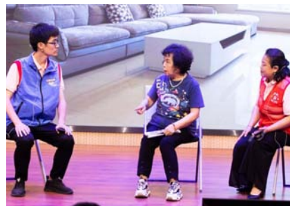
▲武昌区粮道街道东龙社区志愿者表演微小品《“一直帮”服务就在您身边》