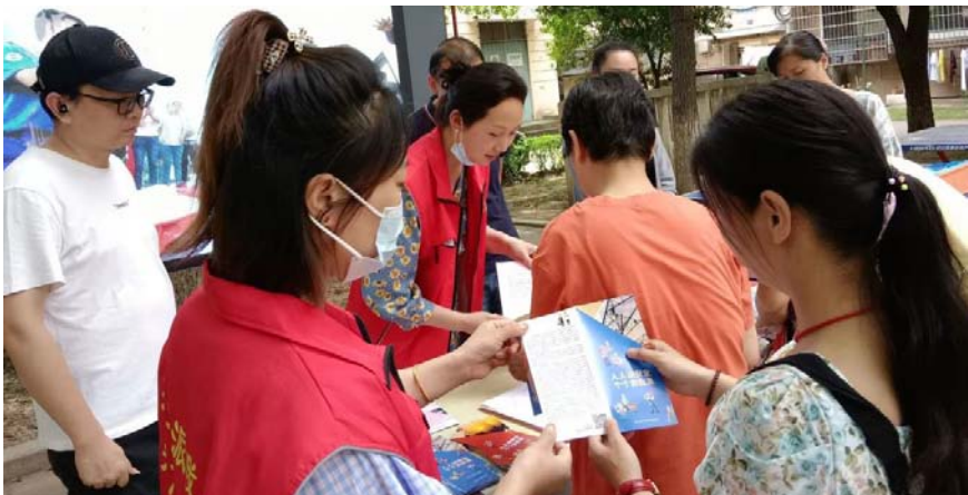
▲志愿者向居民发放宣传折页

近日，武汉市江汉区汉兴街道华苑里社区新时代文明实践站组织开展了“人人讲安全，个个会应急”安全生产月系列宣传活动。社区工作人员和志愿者向居民宣传安全知识，发放应急处置措施宣传物品，营造良好的社区安全生产氛围。