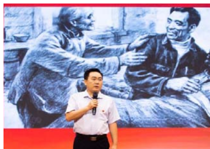
▲余维海教授带大家一起追忆焦裕禄同志的事迹