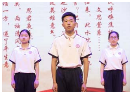
▲武汉市第十四中学的同学们齐声朗诵《念奴娇·追思焦裕禄》