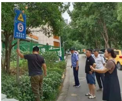
▲幼儿园接送区域设置警示牌

“感谢社区和物业配合我们幼儿园安全工作的开展,保障了小朋友安全上下学。”近日,金色雅园幼儿园负责人向武汉市江汉区汉兴街道玉兰里社区工作人员连连道谢。