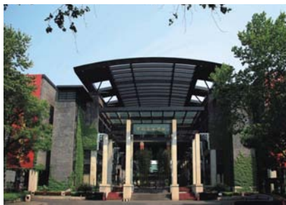
▲浙江·中国美术学院

学院常常和央美相爱相杀。但要说谁更美,国美赢得毫无悬念。尤其是象山校区,美得就像一件艺术品。