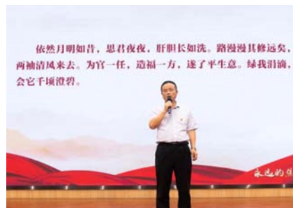
▲段维教授现场解析习近平词作《念奴娇·追思焦裕禄》