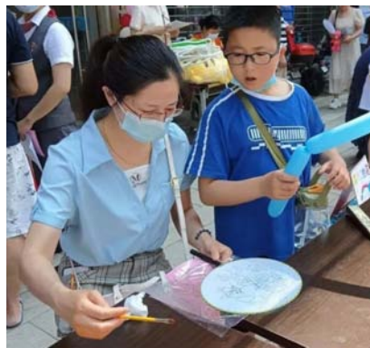
▲母亲陪孩子一起参加公益集市