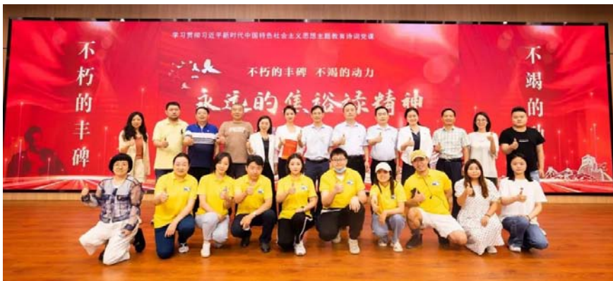
▲湖北广播电视台执行团队与领导嘉宾合影