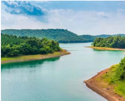
▲荆门漳河风景名胜

位于湖北省荆门市东宝区漳河镇的漳河风景名胜区,以自然景观为主,以人文景观、特别是大型水工建筑群为辅,可供参观、游览、度假和休养。景区内 有山水景观和山石景观两大类,尤以山水景观最具特色,这里风景秀丽,水质天然纯净,是工程、人文、自然和生态的有机集成。到漳河,赏原生态之人文奇观,看纯自然之山水妙象,泛舟冲浪、沙滩沐浴、结伴漂流、采桔赏花、游钓品鱼、飞天走索、露营拓展、参禅祈福,让您享受悠然自得的惬意。