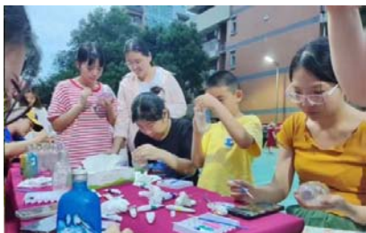
▲居民亲自动手制作民俗工艺品

游戏：电碰迷宫、五子棋、投壶和推铁环等，吸引大家纷纷尝试一把，互动性和趣味性十足，益智竞技的体验感也不差。