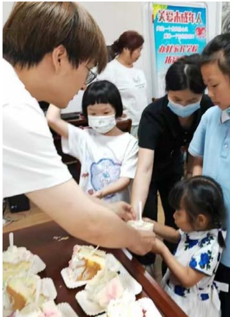
▲党员教师给孩子分发蛋糕

近日,武汉市硚口区长丰街道、永利社区、万帮社工的工作人员前往永利新苑北区,探望一名父母均为聋哑残疾人的事实无人抚养儿童,送上多套崭新的衣物、生活用品以及玩具,表达政府和社会对孩子的牵挂与关怀。