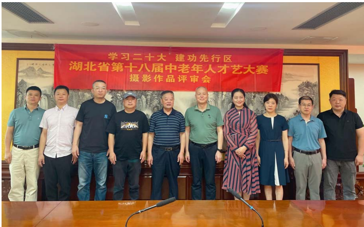
▲组委会领导、成员、评审专家合影

讲难度是非常大的,两只鸟一前一后瞬间形成互补,使用长焦镜头在很短时间拍摄,捕捉到这样的画面,且成像质量非常好,很清晰,难度很大。”