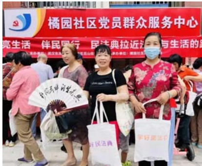
▲志愿者向居民发放宣传册

活动采取线上与线下相结合的方式,线上通过社区“相约周一”法制栏目为大家“案说民法典”,邀请辖区律师从居民关心的生活问题切入解析,用“身边事”解读“大政策”,让居民足不出户就可以通过“橘园好声音”学到法律知识。