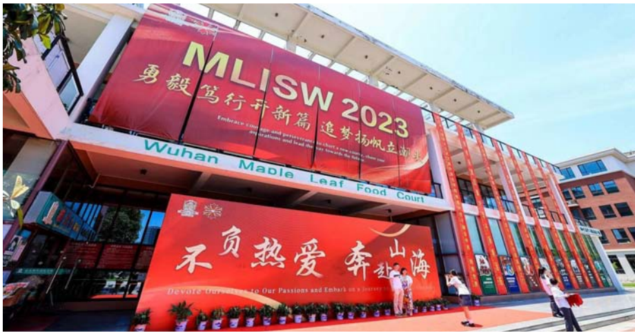
武汉枫叶毕业典礼：志存远方 践行理想之光