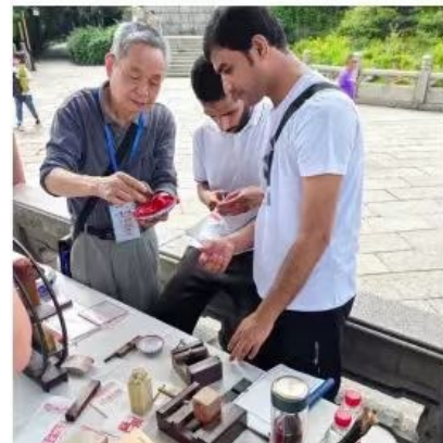
▲志愿者向游客发放书签