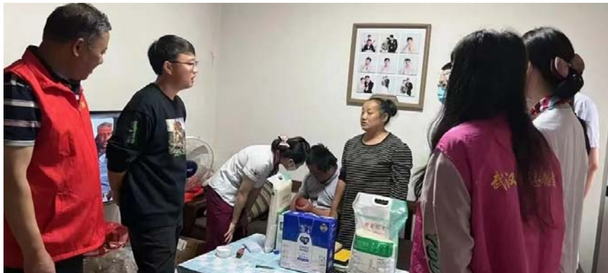
▲志愿者慰问困难母子

笑容的脸庞,我就有了继续走下去的动力。这些年,有了邻里、社区以及你们的帮助,让我在前行的道路上少了