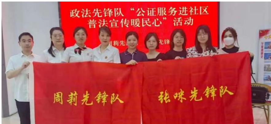
▲先锋队联合进社区

活动号召青少年要知法、懂法、守法、用法,并为社区打造安全、文明、和谐环境贡献力量。 (通讯员 方利)